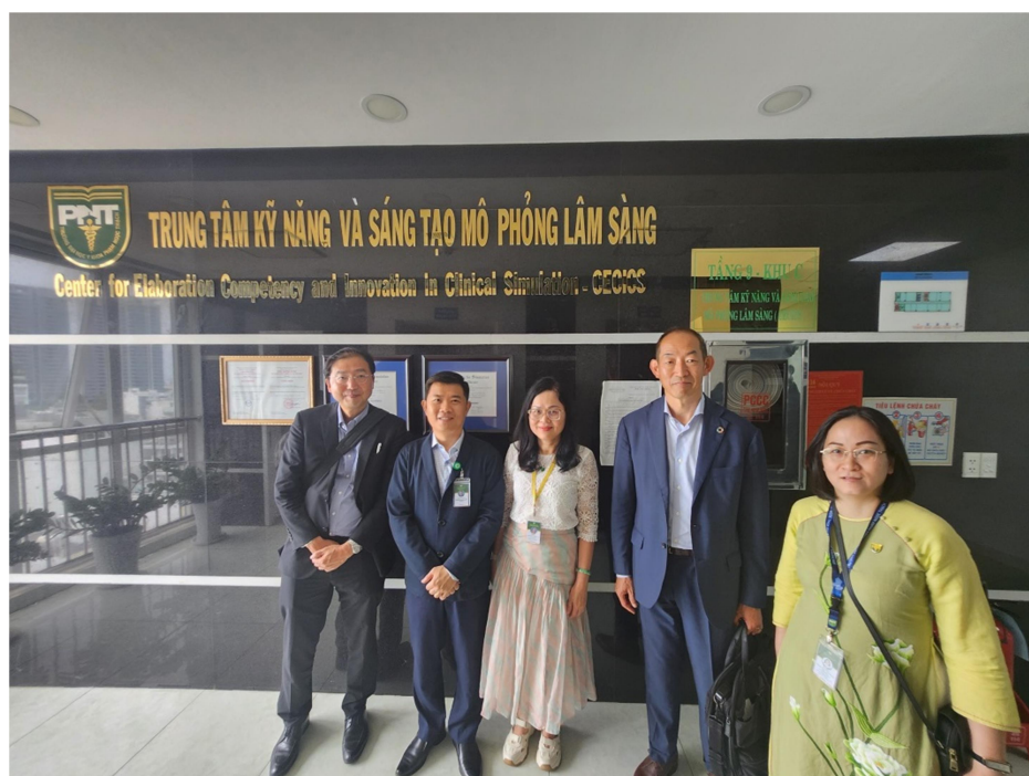
Đoàn chụp hình lưu niệm sau chuyến tham quan Trung tâm CECICS