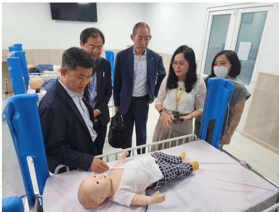
Hình ảnh đoàn Đại học Y tế và Phúc lợi Quốc tế, Nhật Bản tham quan Trung tâm Sáng tạo & Mô phỏng lâm sàng (CECICS) được kiểm định chuẩn quốc tế của Trường