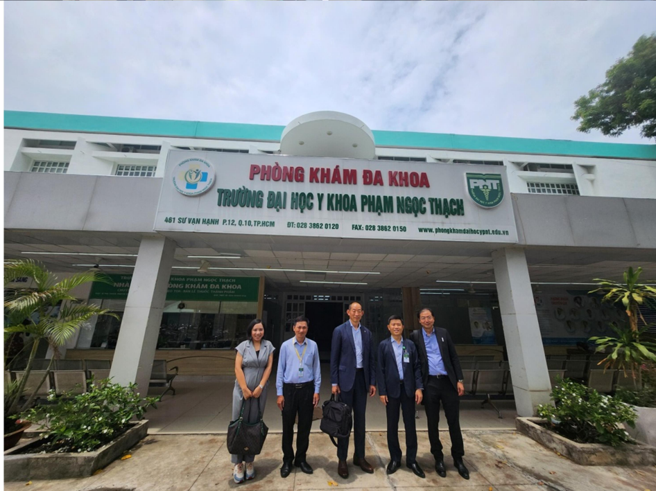
Các giáo sư Đại học Y tế và Phúc lợi Quốc tế, Nhật Bản tham quan Phòng khám Đa khoa trực thuộc Trường